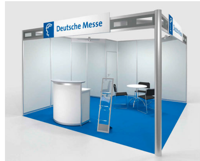
Systemstand Typ A inklusive erweiterte Möblierung