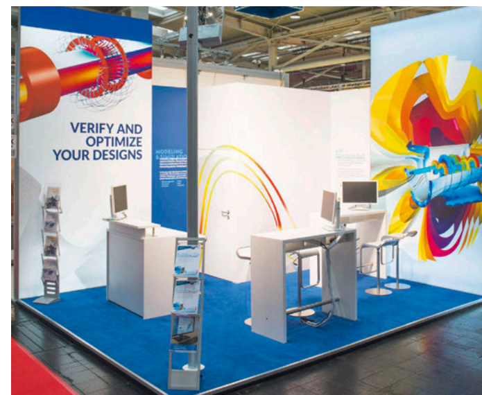
Gestaltungsbeispiel, enthält kostenpflichtige Zusatzausstattung