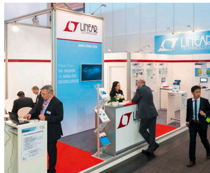
Gestaltungsbeispiel, enthält kostenpflichtige Zusatzausstattung