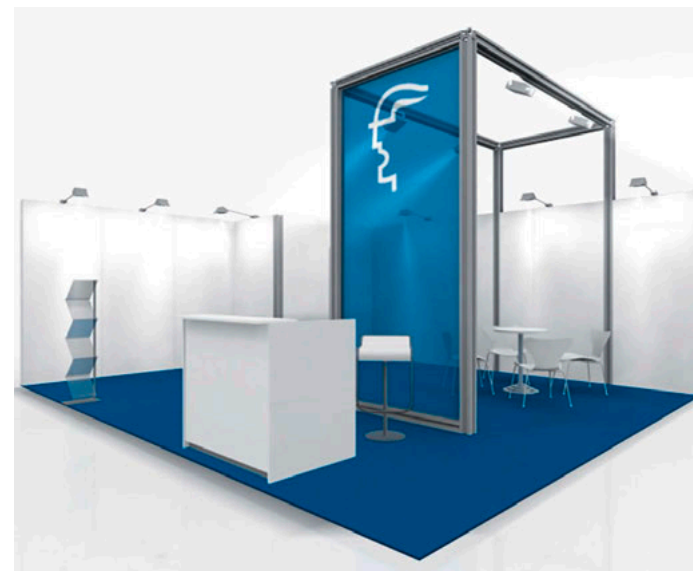
Systemstand Typ C inklusive erweiterte Möblierung