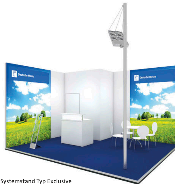
Systemstand Typ Exclusive