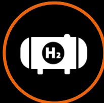
Kompression & Speicherung