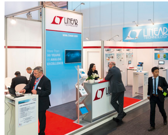
Gestaltungsbeispiel, enthält kostenpflichtige Zusatzausstattung