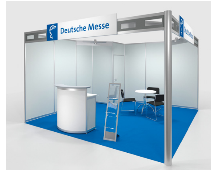
Systemstand Typ A inklusive erweiterte Möblierung