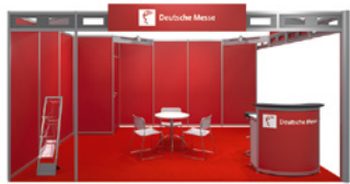
Systemstand Typ A – Fire

Nutzen Sie die Möglichkeit, mit zusätzlicher Ausstattung individuelle Akzente zu setzen.