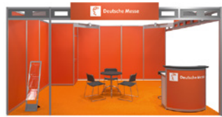
Systemstand Typ A – Orange