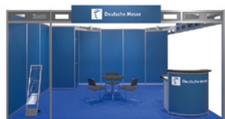
Systemstand Typ A – Ocean