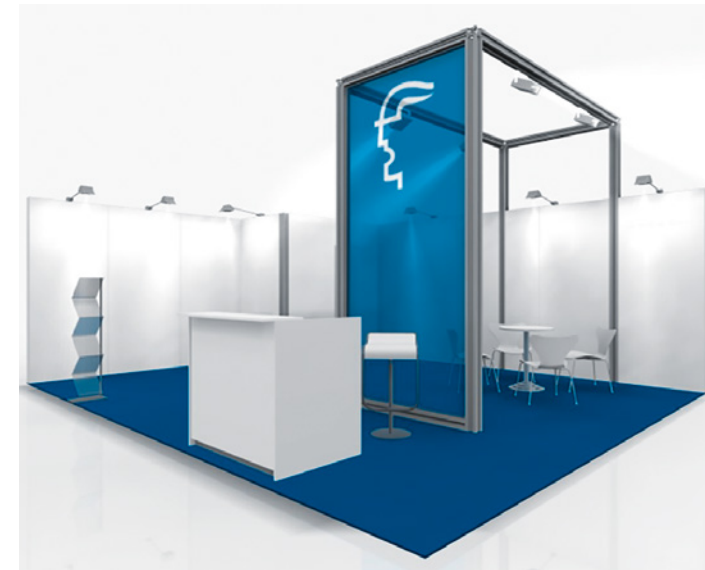
Systemstand Typ C inklusive erweiterte Möblierung