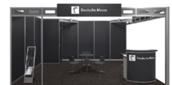
Systemstand Typ A – Black

Tisch und Stühle sind bei allen Farben in Weiß oder Schwarz wählbar.