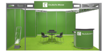
Systemstand Typ A – Lime