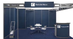
Systemstand Typ A – Midnight