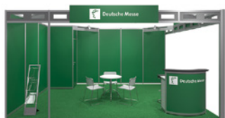
Systemstand Typ A – Forest