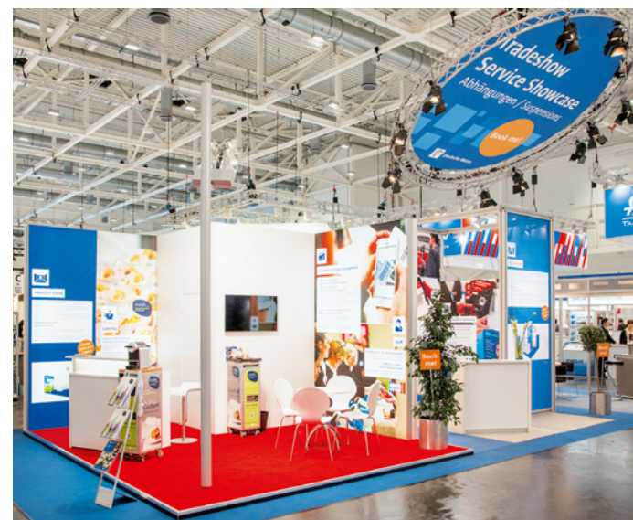
Gestaltungsbeispiel, enthält kostenpflichtige Zusatzausstattung