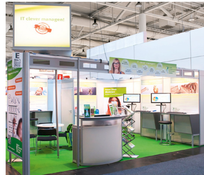
Gestaltungsbeispiel Systemstand Typ A mit Zusatzausstattung